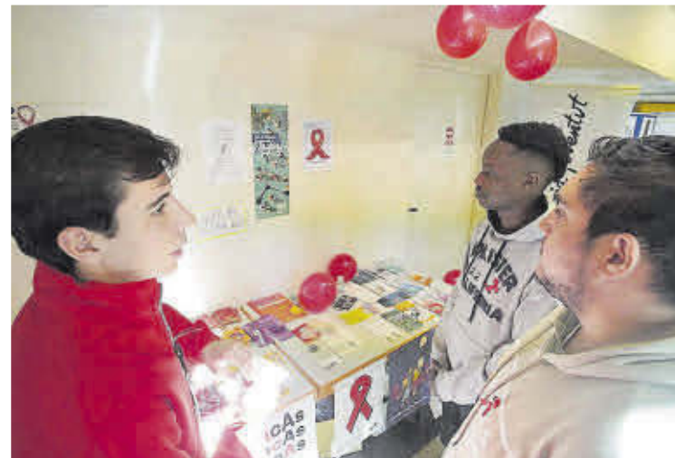
Un voluntari de la Creu Roja en una taula informativa.

Aquests testos detecten anticossos del VIH i si surten positius, es deriva la persona afectada al sistema sanitari; en el cas de Girona, a Medicina Interna del Trueta. «Hi estem sempre connectats per a aquests casos, tot i que val a dir que fa anys que no ens trobem amb cap cas positiu, els últims van ser dues persones immigrades que havien arribat feia poc a Catalunya», concreta.