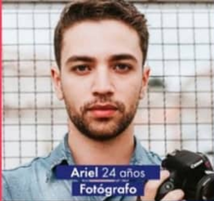
Ariel 24 años Fotógrafo